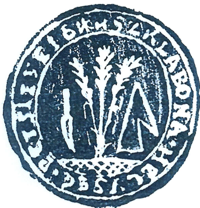
Pečat z roku 1844